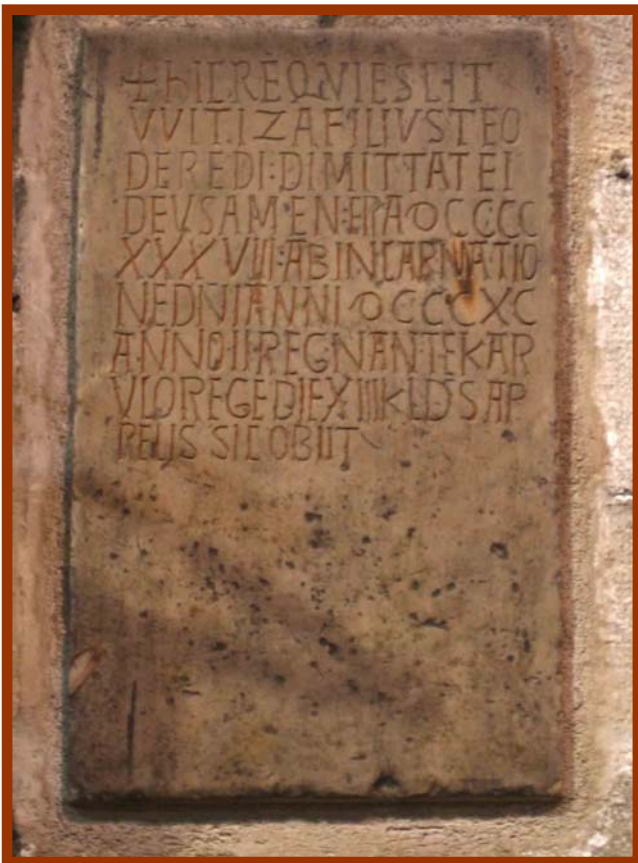
Làpida de Vitiza de l'any 900 descoberta l'any 1736 en el subsòl de l'església, en el lloc on en temps antics hi havia el cementiri parroquial

D'aquest primer període de la nostra història conservem també la làpida de Vitiza, fill de Teodored,